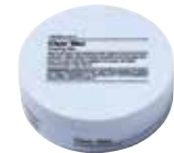
CLEAR WAX Modeliavimo vaškas