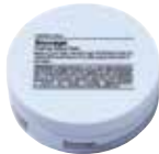
SOUVAGE Tekstūros suteikianti pasta