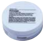
FINISSAGE Tekstūros suteikiantis molis